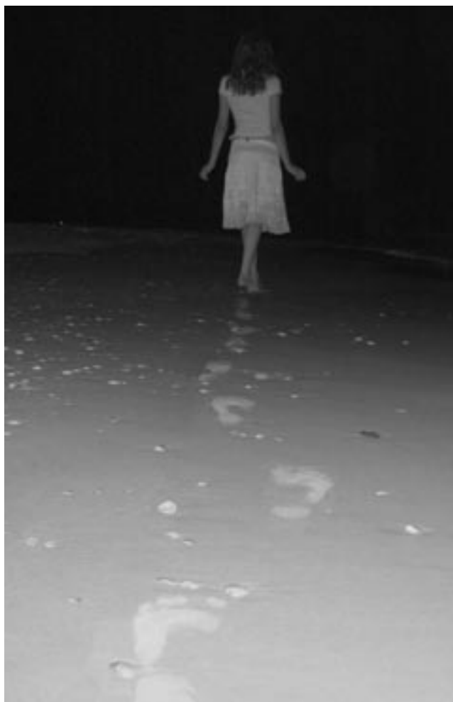
סבינה וינר, "עוזבת"

הבעיות שנזכרו לעיל אינן נעצרות בבתי המדרש או בשאלות הנוגעות לתחומי "אורח חיים" ו"יורה דעה", להלכות שבת וכשרות. לעיתים הן מחלחלות, ובעוצמה רבה, גם לבתי הדין הרבניים, ומביאות לחילול השם בקרב "נמעניהם-לקוחותיהם", שרובם, כידוע, אינו נמנה עם הציבור שומר התורה והמצוות.