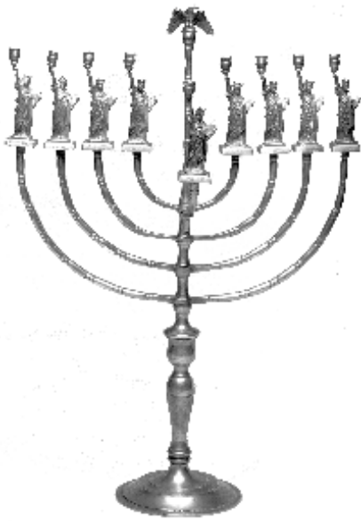
מנפרד אנסון, חנוכה, פסל החירות, ניו ג'רזי 1986

מעמיק ושיטתי כיצד להתמודד אתם באשר לסוגיית הזהות היהודית.