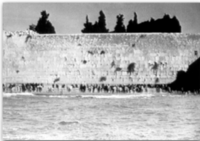
דנה בובעז זונשין ללא כותרת 1996 (עבודת וידאו)

על דרך הרוב, הקהילות העירוניות שלנו אינן מעוניינות ברבנים. ייתכן כי את הסיבה לכך