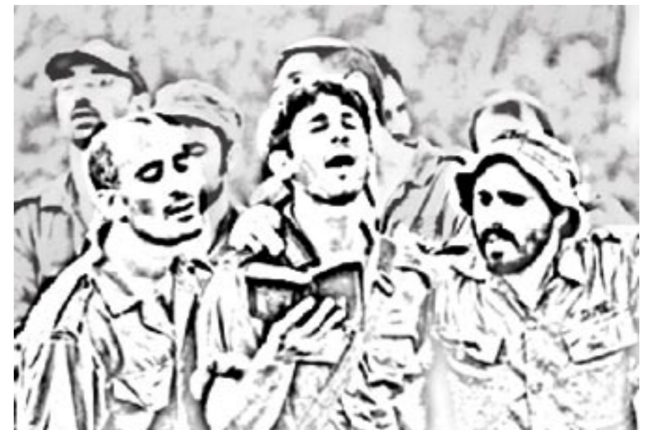
1 שמות י, ו. 2 בראשית א, כח.

"ממלכתי לכתחילה" מחנך את ילדיו להבנת עומק המשמעות של שיבת עם ישראל [לארצו], מברר עמם את עניינינו ואת מהותו של עם ישראל, ומרגיל אותם להיות שומרי חוק ושותפים נאמנים בכל מישורי החיים