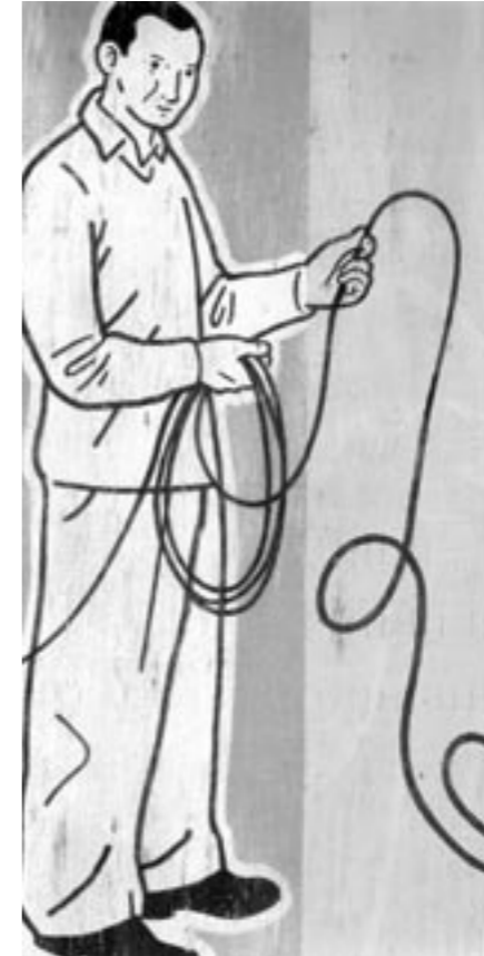
איור: Dan Page

תולדות היהדות הגרמנית בעת החדשה, אך הקורא שאינו מתמחה בתחום ימצא בו בלי ספק נקודת מבט שונה מאוד ומאוזנת יותר מזו שהוצגה לאחרונה ב"דקוויאם גרמני" של עמוס אילון. מאיר מתעניין