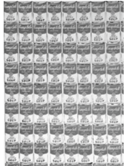
אנדי וורהול, "מאה קופסאות שימורים", 1962, שמן על בד, גלריה ליאו קסטלי, ניו-יורק