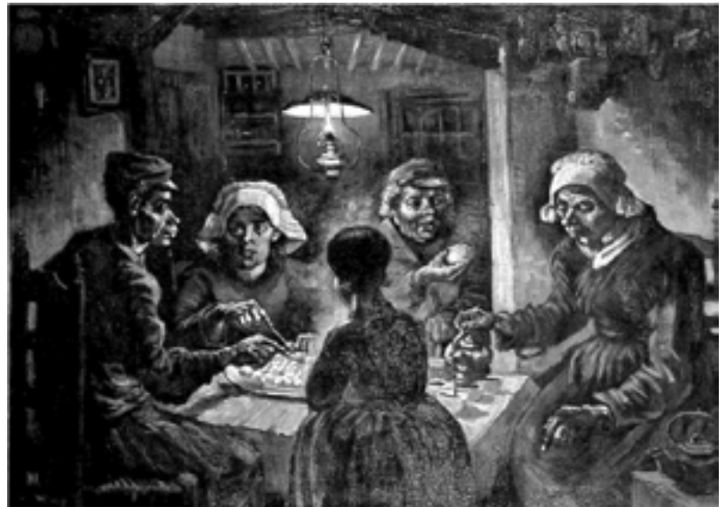
ו' ואן-גוך, "אוכלי תפוחי האדמה", 1885, שמן על בד, מוזיאון ואן-גוך, אמסטרדם

ביצירה "מאה קופסאות שימורים" שורות שימורי המרק הן מטפורה לאדם החי בחברה המודרנית. האדם עצמו הופך למוצר, שאינו שונה משכניו. כמו הקופסאות שעל המדף, הוא תחום בשלו, בלי קשר או היכרות עם השכנים, הדומים לו כל כך. וורהול שואל אותנו, הצופים, מהו המחיר שאנו משלמים על החיים בחברה טכנולוגית? איזה טעם יש לחיים שלנו? כיצד אנו נראים מבעד לשורות האין-סופיות של המרכולים? עולמו התעשייתי והמנוכר של וורהול הוא ניגוד מוחלט לעולם שבו "בזעת אפך תאכל לחם" 23 - הן מבחינת אופני המאמץ להשיג מזון, הן מבחינת היחס בין אדם לזולתו. איש-איש ומרק הקמפבל התפל שלו, כל אחד וחייו התפלים. במסגרת לימוד על ברכת המזון נוכל, למשל, להשוות בין שתי היצירות, לשער כיצד מתייחסים בשתייהן לאדם ולמזונו ולהעמיק במשמעותה של הברכה.