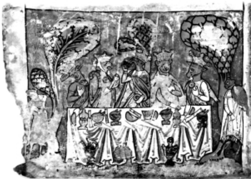
צדיקים בעולם הבא, כתב יד תנ"ך האמברוויאנה, גרמניה, המאה ה-13