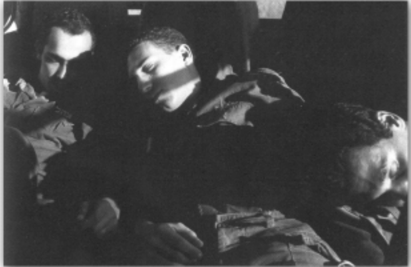
עדי נס 1999

1. ראשית, עד היום, כאמור, אין כל הוכחה מחקרית לכך שהטיפולים המוצעים עוזרים לשינוי בסיסי של הנטייה המינית. לא נעשה אף מחקר רציני במתודולוגיה ראויה – הפרסומים עד כה מבוססים רק על דיווח עצמי של המטופלים, ללא כל קבוצות ביקורת – וגם שיעור ההצלחה של הטיפולים הללו עומד תמיד על מיעוט מקרי המטופלים. 14 מנגד, מחקרים מראים כי פעמים רבות טיפול זה גרם לפגיעה נפשית קשה במטופלים. 15 למרבה הצער, גם טיפולים שהוכתרו בהצלחה הסתיימו במקרים ידועים אחדים במפח נפש. 16 אירועים כגון אלו אינם מגבירים, כמובן, את האמון ברעיון כי שינוי נטיות מיניות הוא בגדר האפשרי. 17 2. הנחה בסיסית של טיפול ההמרה (reparative therapy), שבאה לידי ביטוי בין השאר בספריו של ניקולוסי, 18 היא שההומוסקסואל סובל ממחסור בזהות גברית ולכן הוא מחפש אותה אצל בני מינו ואינו מסוגל לקיים קשר עם אישה בגלל חוסר ביטחון עצמי. 19 ההנחה היא שכשהוא יתחבר לגבריות שלו הוא יוכל לתפקד כגבר לכל דבר. בעייתו של ההומוסקסואל, לשיטה זו, נובעת בעיקר מקשר לקוי בינו לבין אביו בעודו