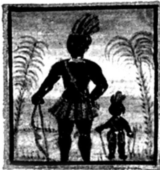
ברוך משנה הבריות, מתוך כתב יד 'סדר ברכת המזון עם ברכות הנהנין', וינה 1740

וכי ניתן בהחלט להתגבר עליה, בכלים טיפוליים מתאימים בשילוב אמונה דתית. זהו הארגון היחיד שנתמך על ידי רבנים, ולכן זוהי הכתובת היחידה הקיימת עבור ההומוסקסואל הדתי, בחיפוש אחר תשובות לשאלותיו (כל גולש באינטרנט שיקליד במנוע חיפוש ישראלי את המונח 'הומוסקסואליות' - יגיע מיד לכתובת האתר, מן הראשונים ברשימה שמתקבלת). מאמר זה ינסה לבחון את האופן שבו מתמודד הארגון עם הנושא, וינסה לדון ביתרונותיו