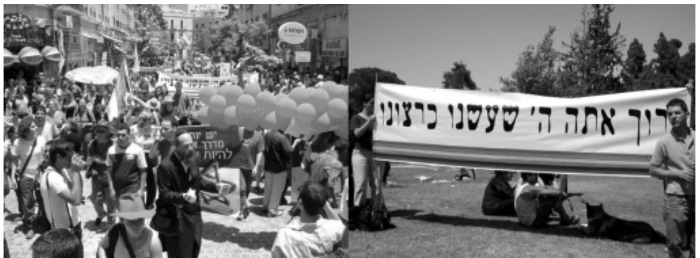
מצעד הגאווה, ירושלים 2003

מדובר בתופעה הקיימת בקרב כל העמים וכל התרבויות לאורך ההיסטוריה – מיוון העתיקה ועד מצרים, מן האינדיאנים ועד איי האוקיינוס השקט – הנטייה קיימת בקרב אחוזים אחדים