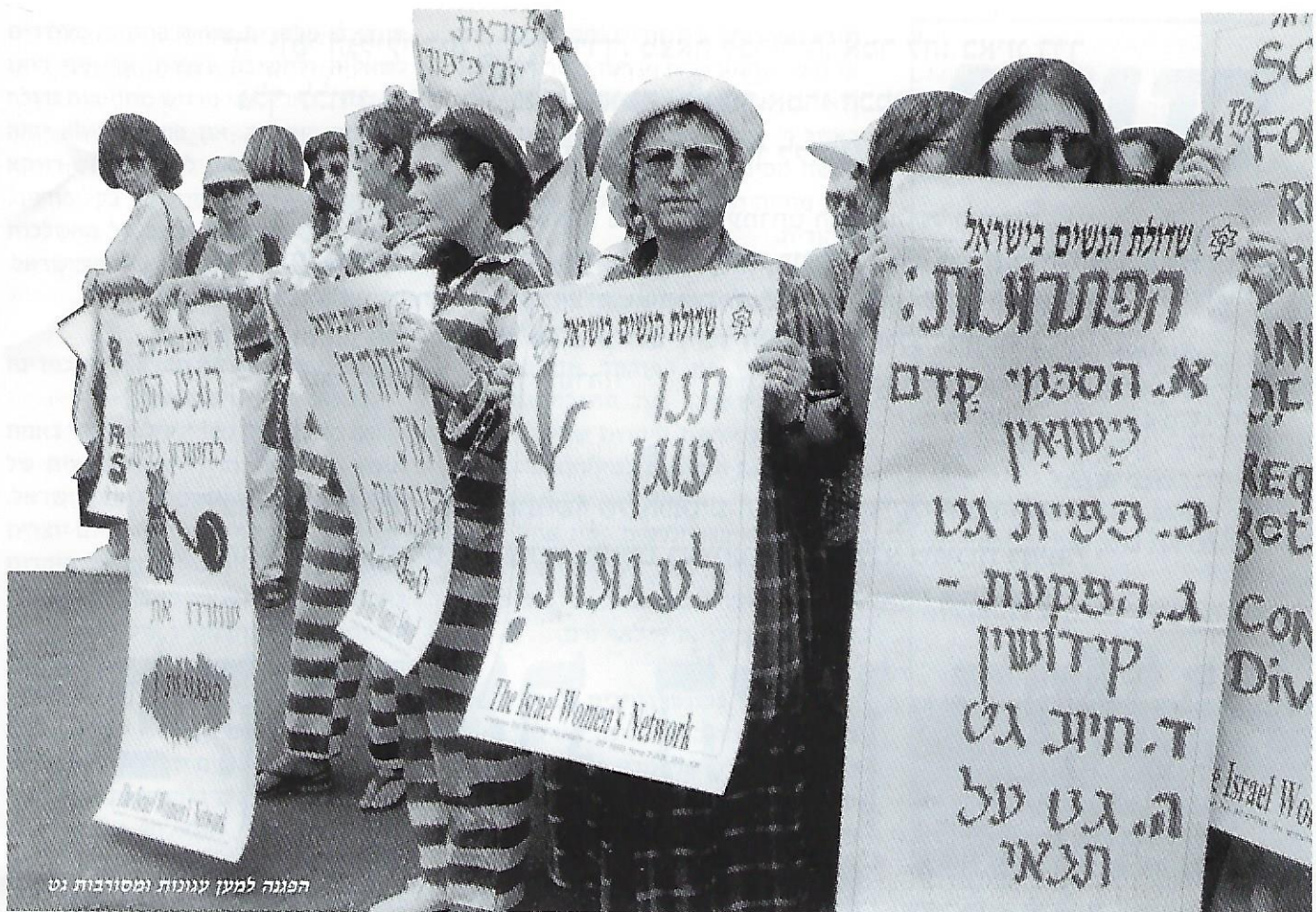
הפגנה למען עגונות ומסורבות גט

הנשים, שכן הגיעה העת לברר הלכות אלה ואחרות לנוכח קיומו של הפמיניזם הדתי כעובדה מוגמרת ובלתי הפיכה: הרב אליעזר ברקוביץ, הרב אבי וייס, הרב אריה פרימר, הרב יהודה הנקין, ואחרים.