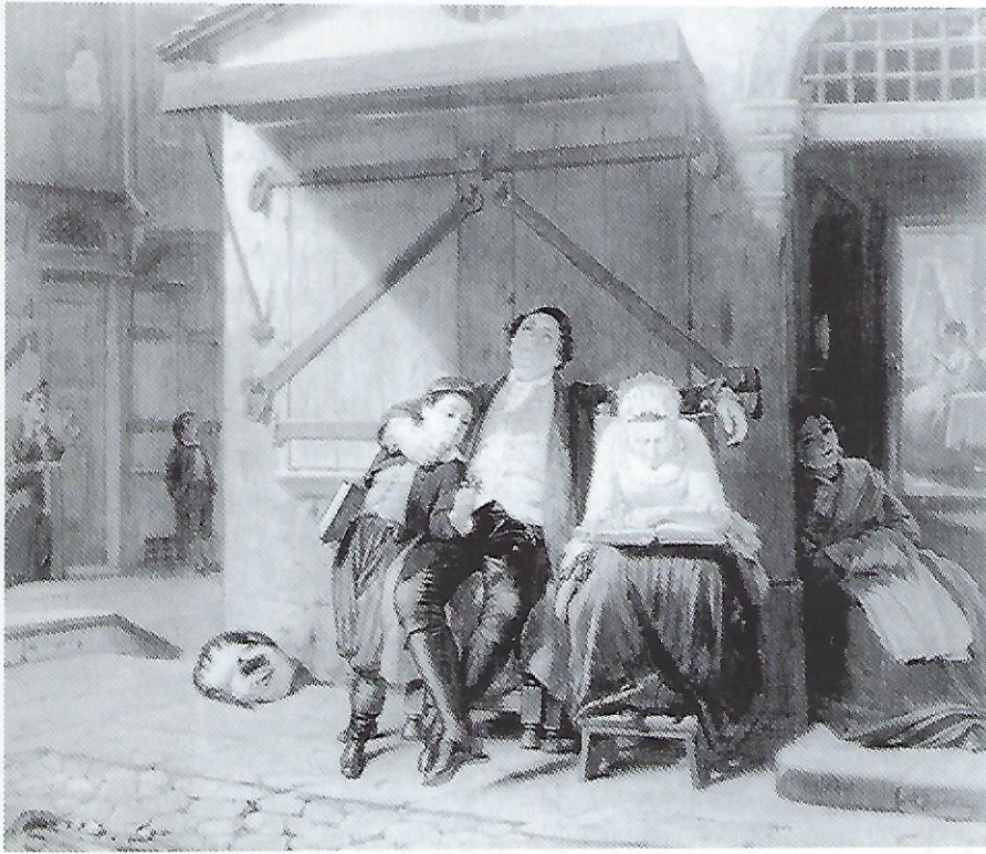
מוריץ אופנהיים - 1789

של אוניברסיטה חילונית כגון אוניברסיטת קולומביה ופנסילבניה בארצות הברית, או עם אלו שבסניפי בני עקיבא בישראל. בקמפוס האמריקאי הנשים מגיעות במספרים גדולים ואילו במקום מגוריהן הן נשארות בבית. מובן שלתופעה הראשונה ישנן גם סיבות חברתיות, אך דומני כי הסיבה היסודית יותר היא שעל אף כל מגרעותיו, הקמפוס החילוני מעביר את המסר שהנשים הינן שותפות מלאות, בעוד בתי הכנסת שלנו - לא. באופן דומה, נשים שהשתתפו בקביעות בתפילות מנחה בבני עקיבא, שם מעורבות משותפת של צעירות וצעירים היא הנורמה, אינן מגיעות לבית הכנסת בשבת אחר הצהריים כשהן מתבגרות. ישנן אף נשים המגיעות לשיעור בבית הכנסת לפני מנחה ואז יוצאות כשמתחילה התפילה, על אף היותן כבר בתוך בית הכנסת! זאת למרות העובדה שהן מחוייבות בתפילת מנחה ולרוב אינן עסוקות בעבודות הבית.