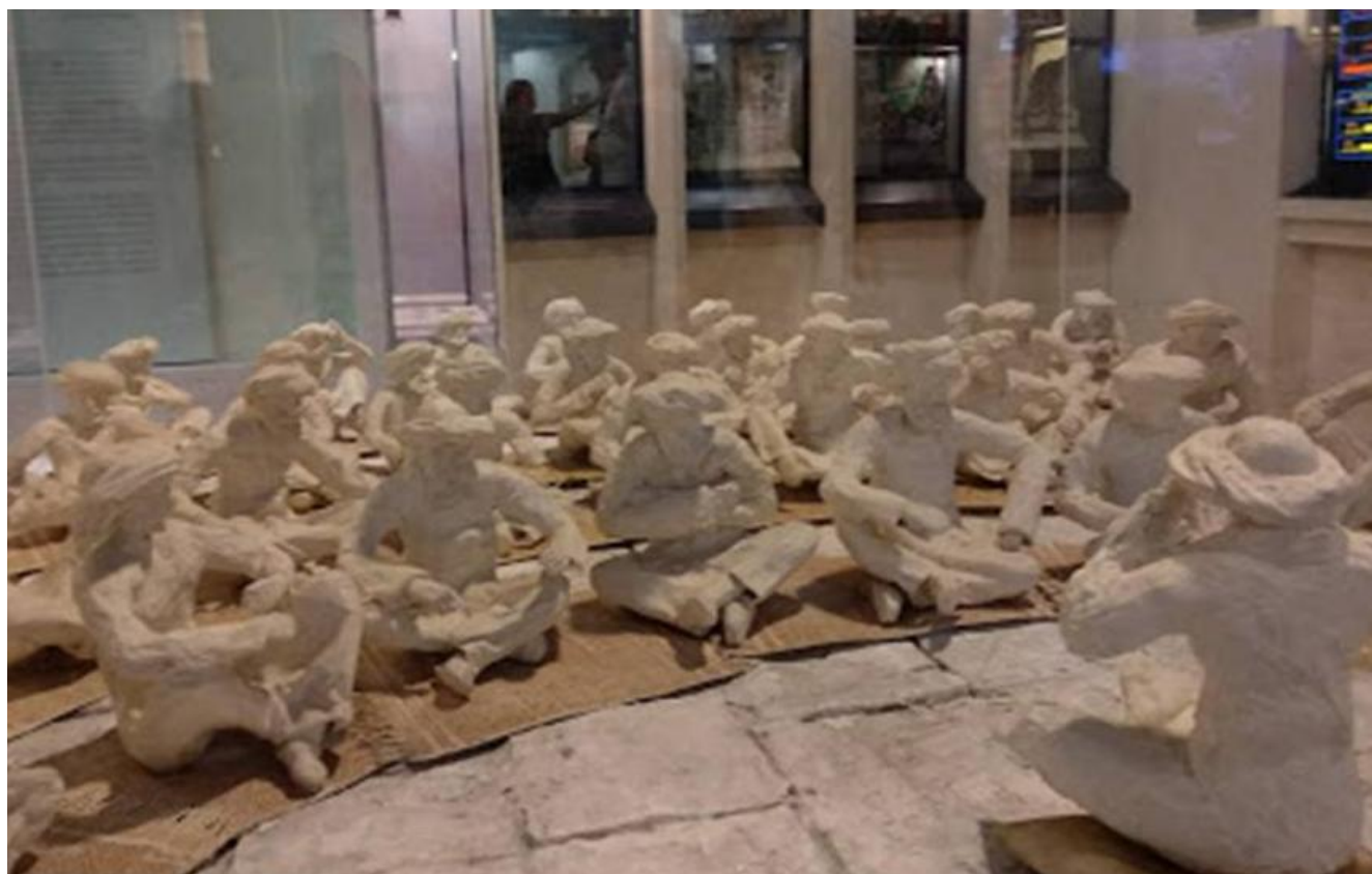
בית המדרש בבבל בתקופת התלמוד

מסכת אבות בנויה ממאמרים קצרים של חכמי המשנה - התנאים, כאשר בדרך כלל המאמר המובא, הוא המוטו לחיים של אותו תנא, וניתן לראות בו תמצית של השקפת עולמו הייחודית. סדר החכמים המופיעים במסכת נקבע בעיקר על פי סדר הדורות, מאנשי כנסת הגדולה, דרך תקופת הזוגות ועד אחרוני התנאים.